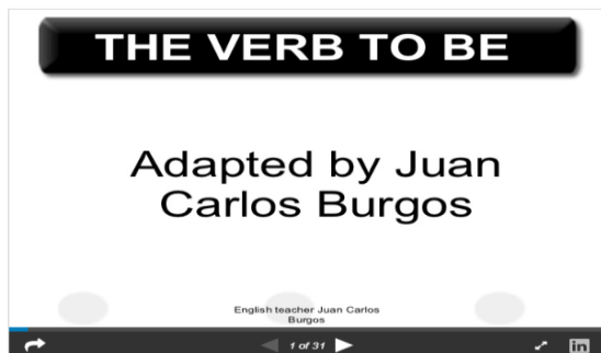
Verb to be ppt from Juan Burgos

Para complementar la información presentada en el video los invito hacer click en la siguiente presentación que incluye ejemplos del verbo "to be" en preguntas y oraciones, asimismo, visualiza unos "charts" de la forma afirmativa y negativa del verbo "to be" en forma corta y larga brindando ejemplos en contexto, así como su significado o uso en distintos contextos como descripciones, clasificaciones/definiciones, localizaciones, lugar de origen, edad, clima y tiempo.