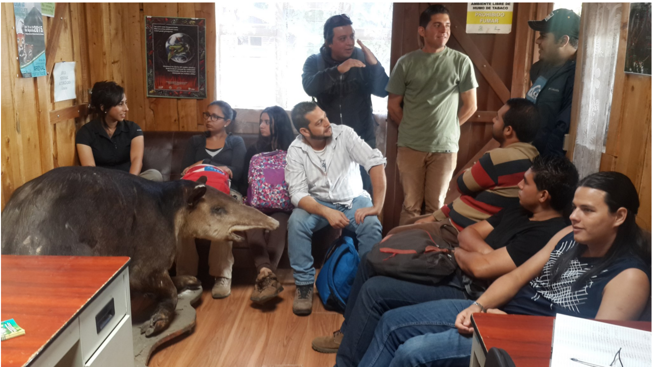
Fotografía del grupo de aprendientes, durante la actividad.

Fotografías que ilustran la estrategia de aprendizaje. Tanto el profesor como los aprendientes, autorizaron su publicación.