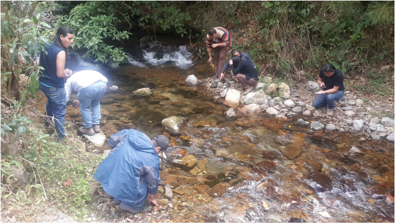
Aprendientes en el cuerpo de agua, tomando las muestras.