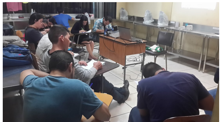
Aprendientes durante la fase inicial del proyecto.

Personalmente, esta experiencia generó en mí y en mis compañeros, una gran motivación hacia la carrera, ya que en la participación en este tipo de actividades, nos permiten experimentar un acercamiento con el ambiente y ecosistemas, lo cual sirve de preparación para nuestra futura vida profesional.