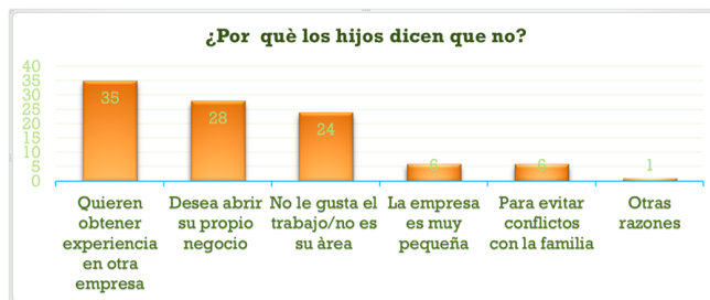
Figura 1. Gráfico proporcionado por el autor del editorial.

Solo como referencia, el 50% de las empresas familiares logran llegar a segunda generación en este relevo, pero únicamente el 5% de los casos logran llegar a la tercera generación. Lo anterior, se debe a diversas causas, pero una de las principales es que las nuevas generaciones deciden obtener experiencia en una empresa diferente a la familiar (ver figura 1).