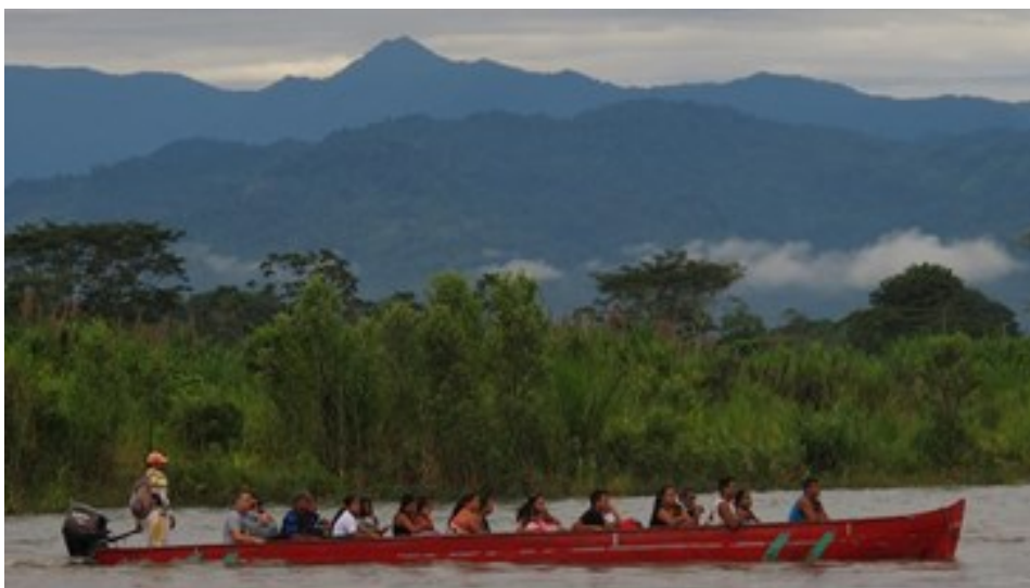
Imagen con fines ilustrativos.

Talamanca vivirá siempre en mí y yo en sus entrañas.