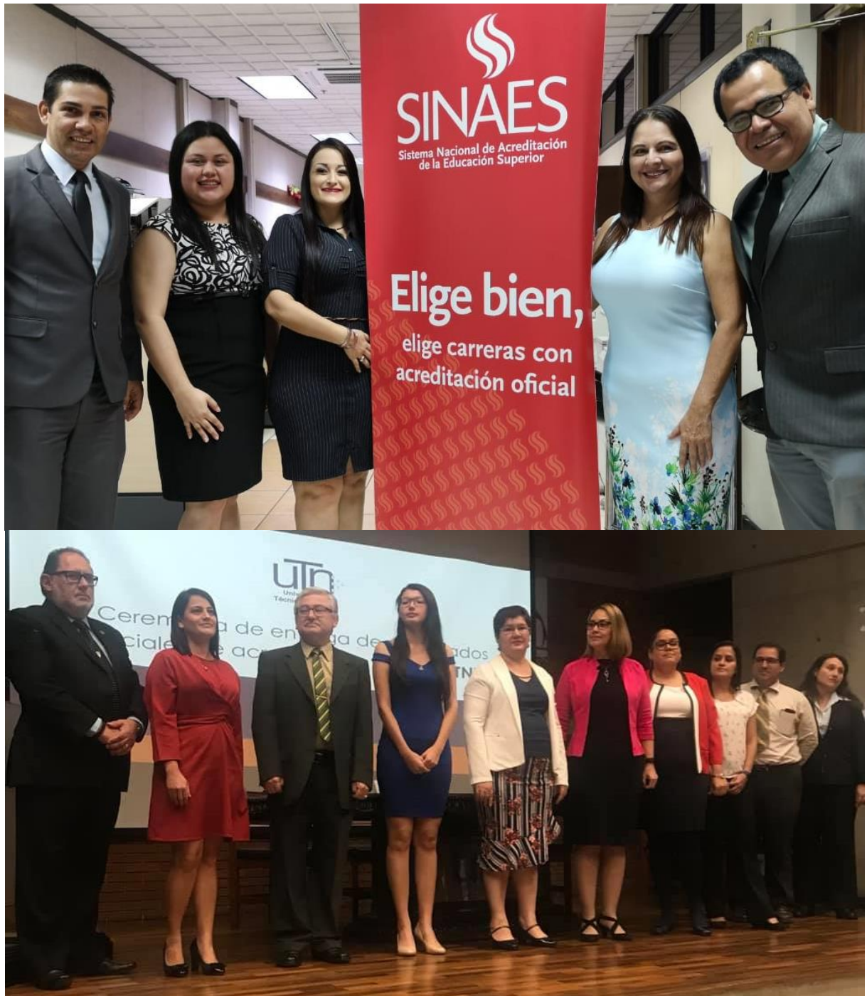
Figura 3-4: Directores de Carreras, profesores de Contabilidad y finanzas, Ing. Del Software, recibiendo su acreditación.

En relación con el proceso de acreditación de carreras se logró que las carreras de Contabilidad y Finanzas, así como Ing. del Software, fuesen acreditadas, este decanato sigue sin comprender porque la carrera de Recursos Humanos, no logro su cometido. Actualmente las carreras de Comercio Exterior y tecnología de la imagen se encuentran en este proceso.