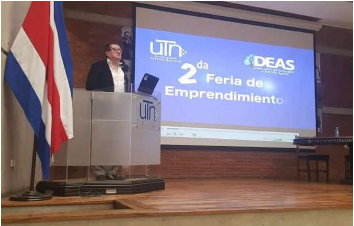
Figura 6: Proyecto de innovación y emprendurismo, deberán continuar forjando esa cultura de transversalización universitaria, tan necesaria y permear la gestión académica, la investigación y la acción social. Sin duda requiere una nueva mirada de integración, motivación y articulación.