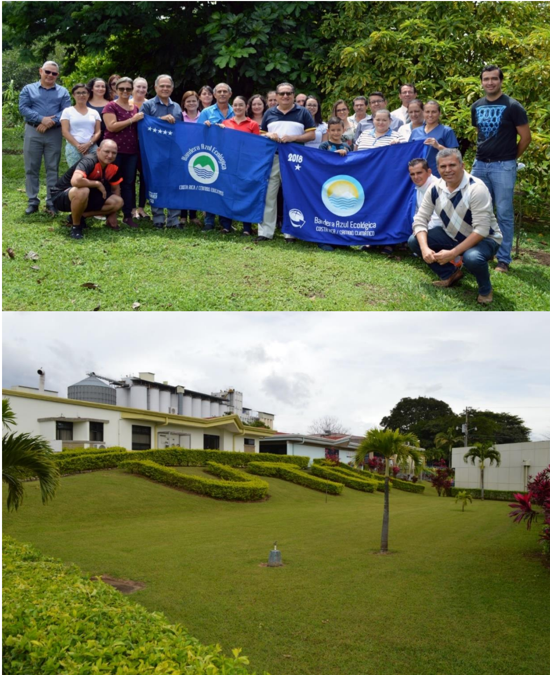
Figura 14-15: Programas ambientales certificaciones, Concepto de Eco-Campus. UTN

Es importante, brindar seguimiento y consolidación, al proyecto denominado, comunidades sostenibles, ligado al programa de bandera azul ecológica, para centros educativos y cambio climático. Así como al bosque Sa-kami-na, con el fin de lograr la carbono -neutralidad y la consolidación de comunidades sostenibles. Actualmente contamos con cinco estrellas y dos en cambio climático.