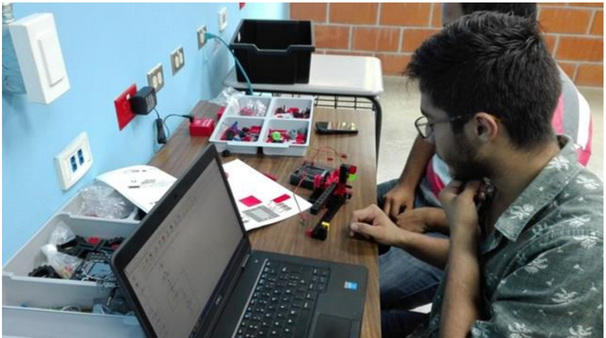
Figura 5: Proyecto Robótica, de la carrera de Electrónica.