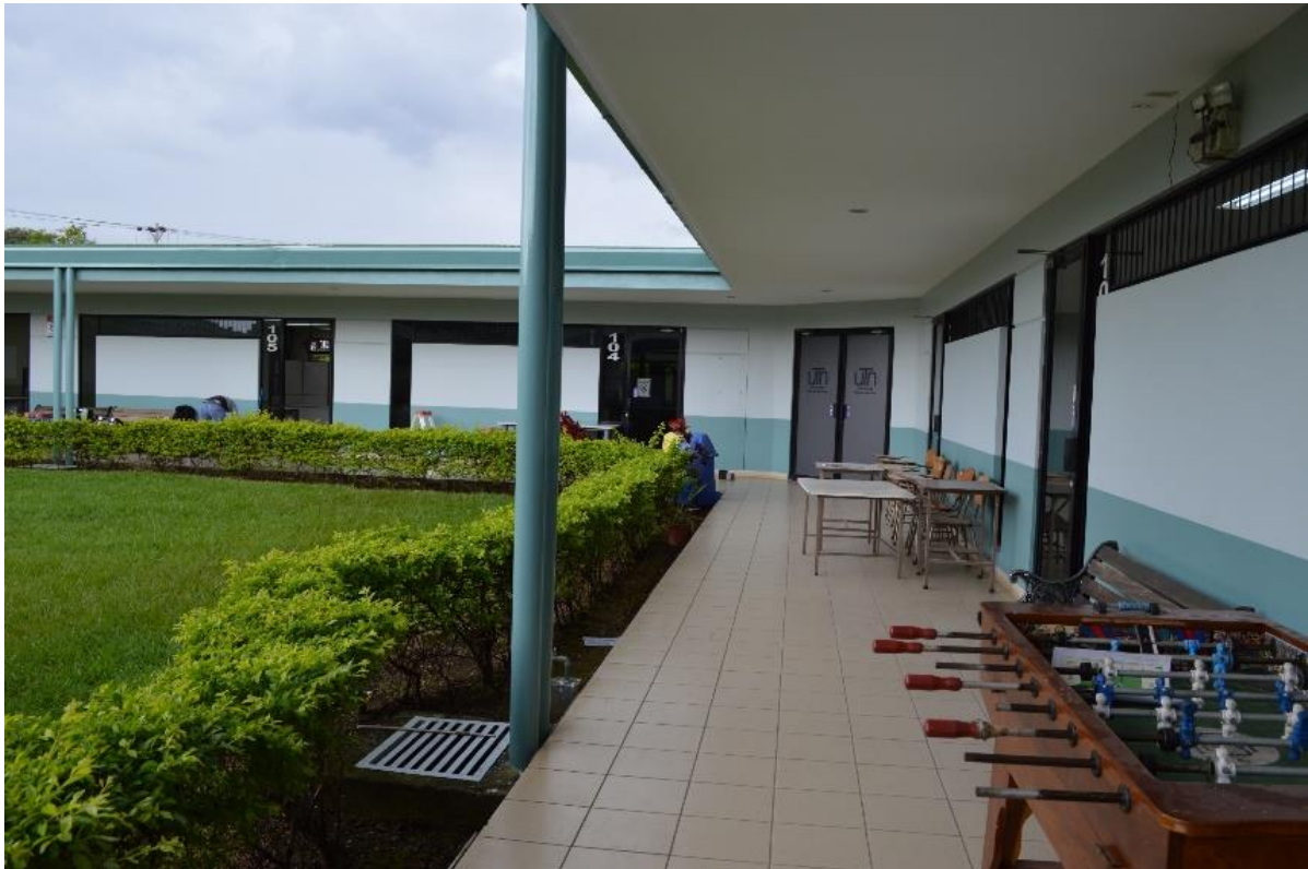
Figura 7: Remodelación del módulo uno, áreas destinadas para el personal docente, atención de estudiantes.