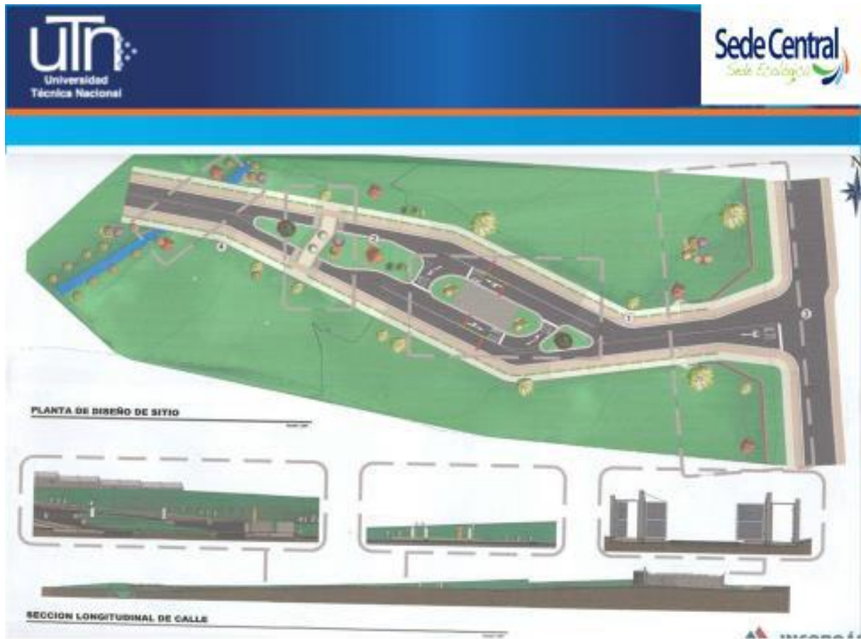
Figura 18: Diseño, ingreso a las instalaciones

6.4 Ingreso a la Sede Central, este proyecto es vital, en virtud de los problemas de escorrentías de aguas pluviales, al generar inundaciones, ocasionar accidentes mortales y se convierte en una trampa para nuestros usuarios.