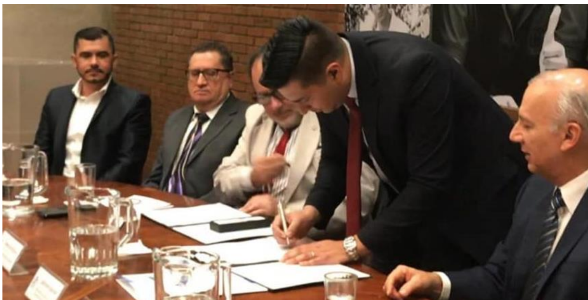
Figura 11: Celebración del 40 aniversario de la carrera de Ing. Salud Ocupacional y Ambiente, firma de convenio Ministerio de Trabajo y Seguridad Social.