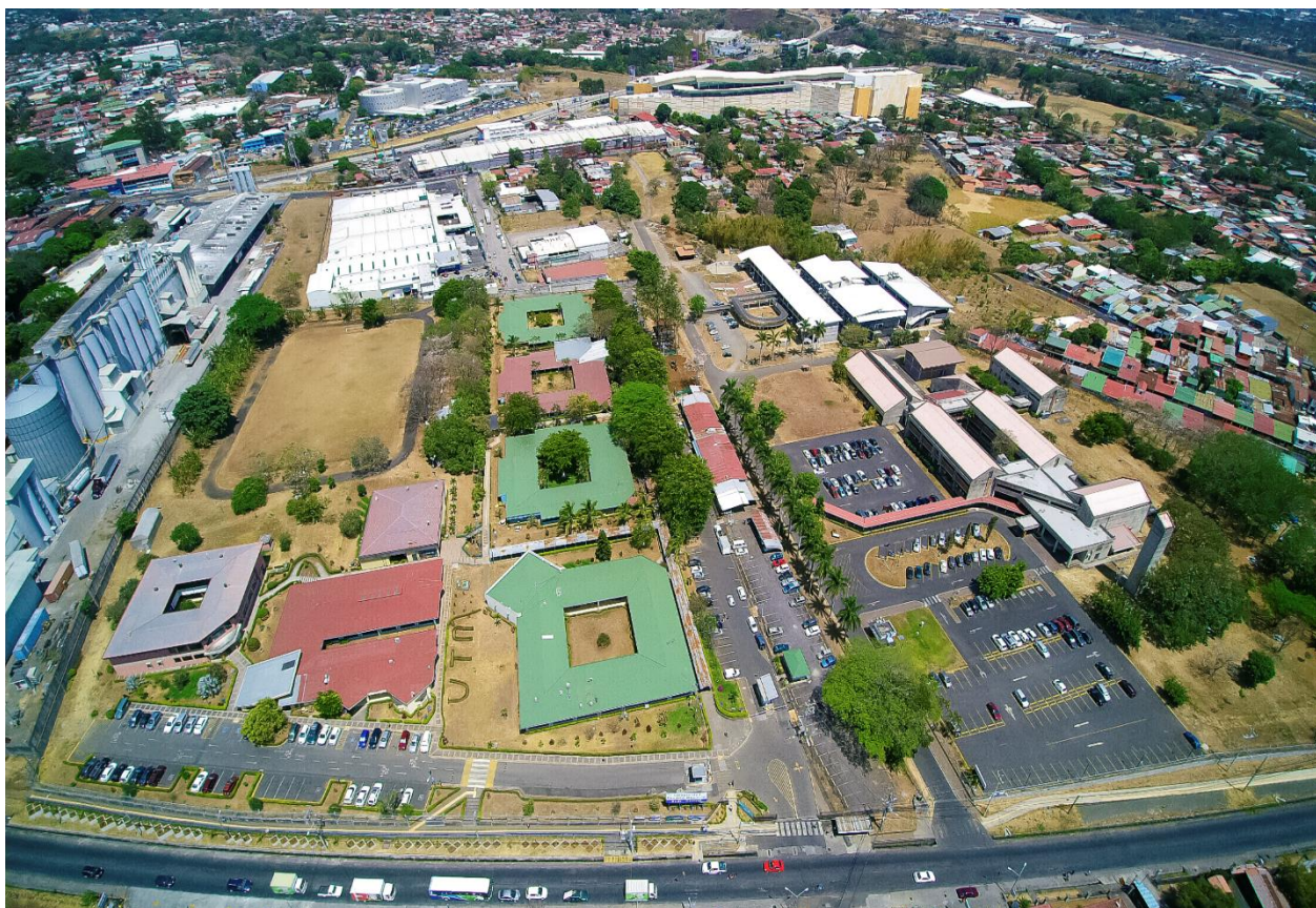
Figura 1: Vista aérea de la Sede Central de la UTN, Villa Bonita de Alajuela.

En respuesta a su oficio ACYS-168-2020 de fecha 3 de junio, y en cumplimiento al Artículo 12 de la Ley General de Control Interno, se adjunta informe de fin de gestión del Decano de la Sede Central por el periodo comprendido entre el 01 de julio de 2016 al 30 de junio de 2020.