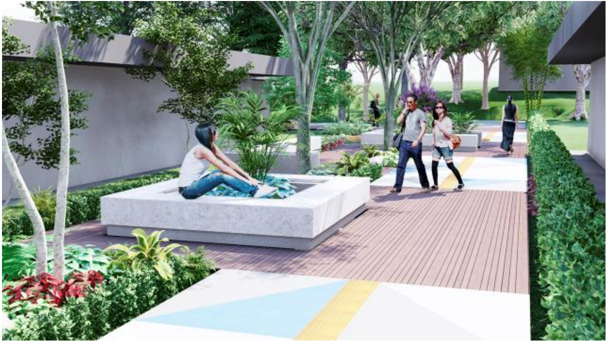
Figura 12: Diseño de pasillos, Sede Central.

5.2 Dar seguimiento al proceso para la creación de un software para la gestión de becas.