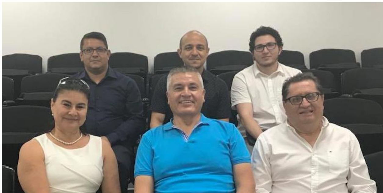
Figura 2: Miembros del Consejo de la Sede Central, periodo, 2016-2020

Es importante considerar, como se plantea en el informe desarrollado por el Consejo de sede, las condiciones particulares de algunos de los miembros, situación que debió ser considerada para la continuidad del mismo, así como la actualización del libro de actas.