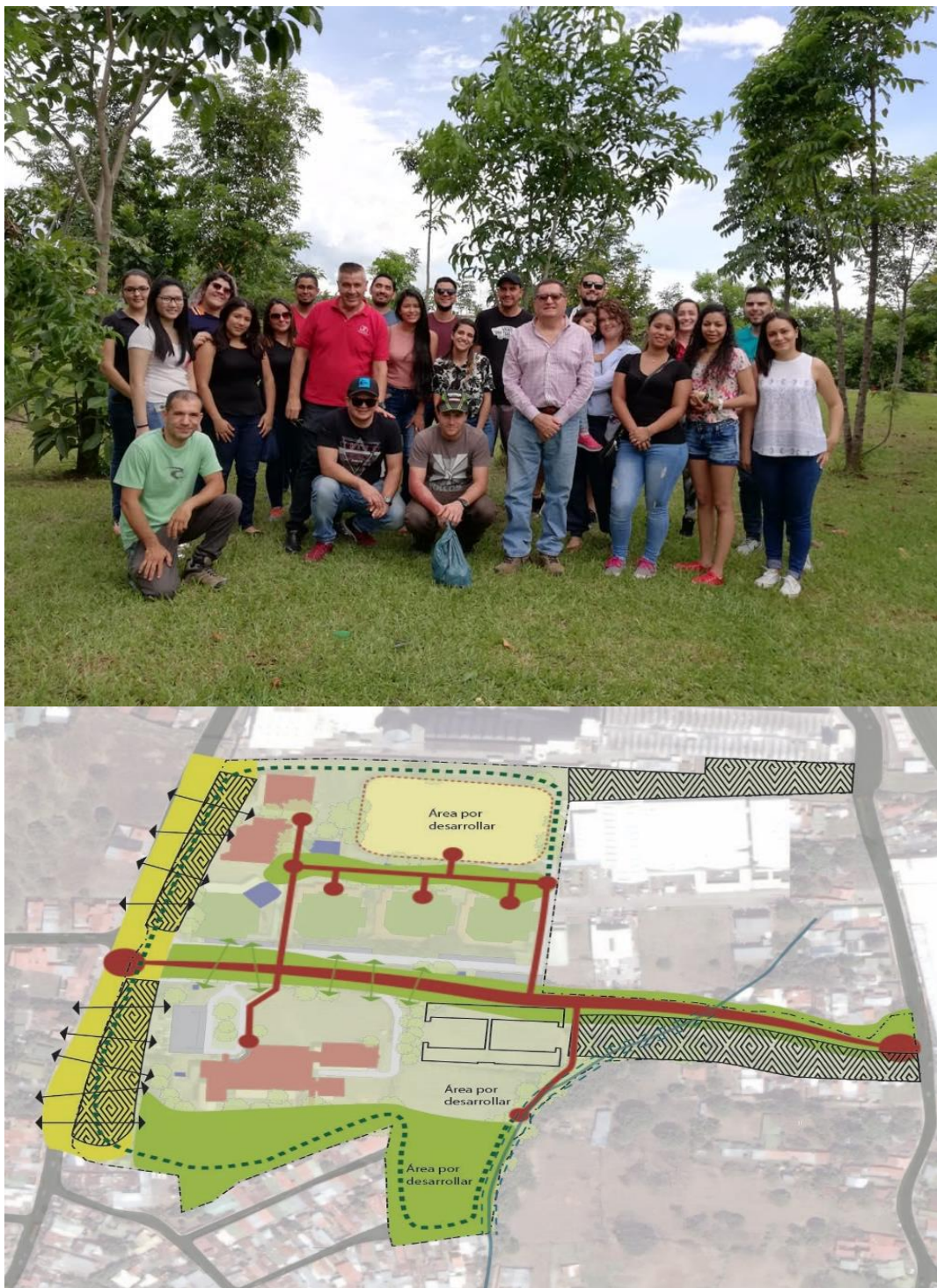
Figura 16-17: Bosque Sa-Ka-mina, Plan regulador- Sede Central, UTN.

El plan maestro, se recomienda mantenerlo y continuar con sus diseños y proyecciones