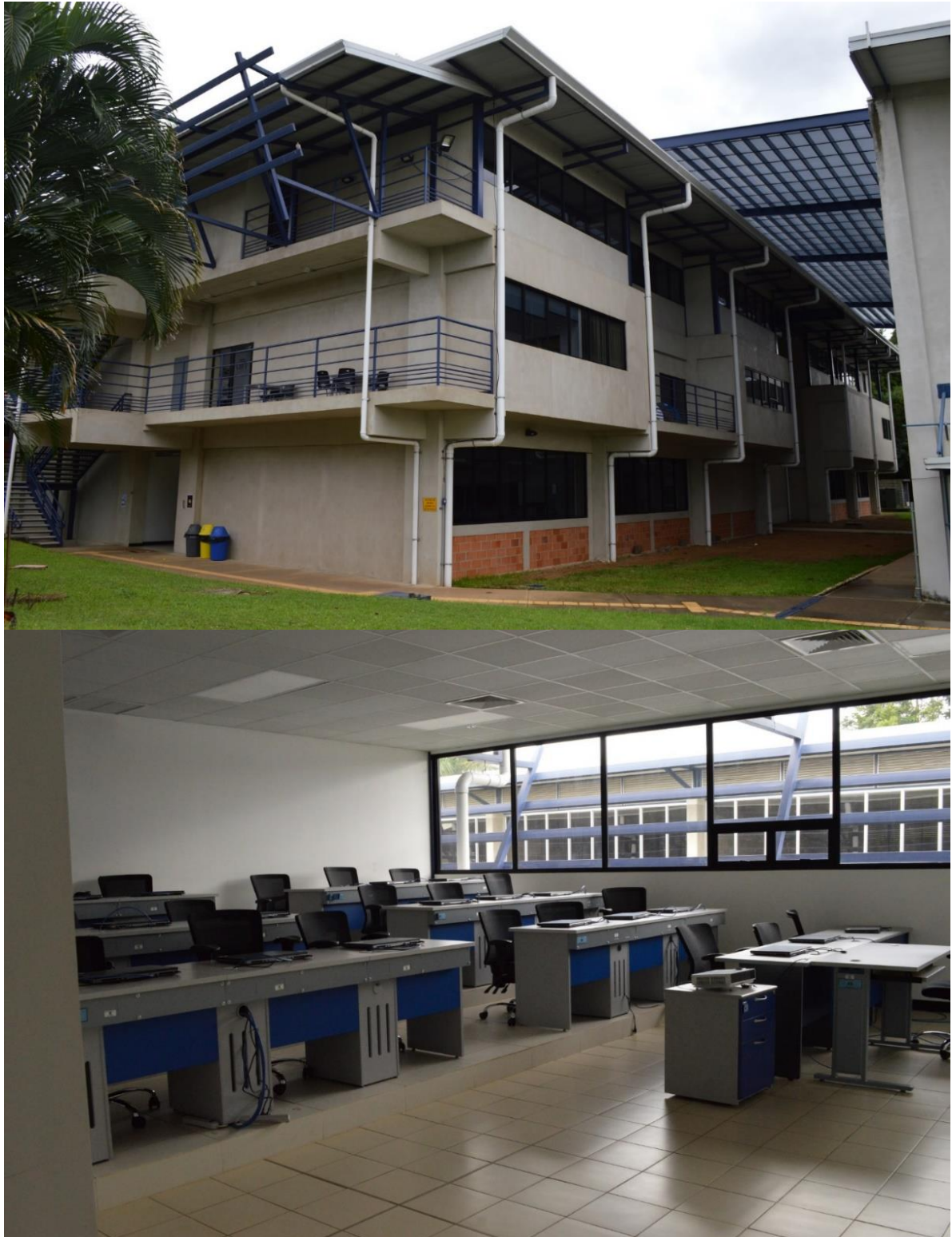
Figura 8-9: Construcción torre de laboratorios, mobiliarios y equipos.