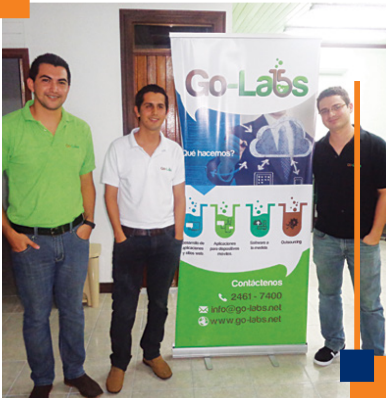
Fundadores de Go-Labs

En Go Labs se incentiva a los colaboradores que están estudiando para que no abandonen los estudios y terminen su carrera, por lo que están anuentes a colaborar en caso de que requieran algún tipo de permiso para cumplir con los compromisos académicos.