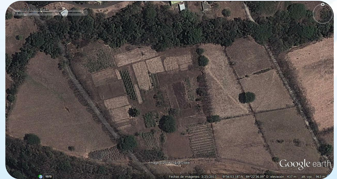
Parcelas experimentales, UTN sede Atenas

Introducir un forraje productivo y sostenible, bajando el costo y el riesgo (económico/biológico); utilizando oportuna y eficientemente el ambiente, variedades y la tecnología.