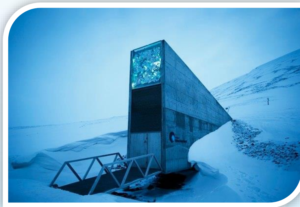
Bóveda Global de Semillas de Svalbard . “El Arca de Noé”

“LAS SEMILLAS SON SIEMPRE FUERZAS POSITIVAS Y CREADORAS. ELLAS SON EL GERMEN DE LA VIDA EL PRINCIPIO Y EL FIN. EL FRUTO DE LA COSECHA DE AYER Y LA PROMESA DEL MAÑANA.” FREEMAN