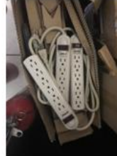
4 Extensiones eléctricas