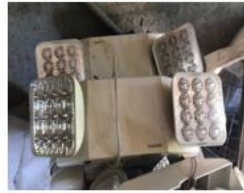
Lámpara de emergencia