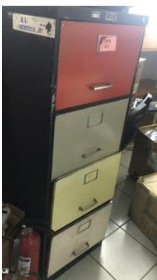
Archivador 4 gavetas de colores