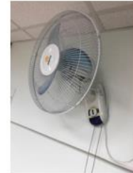
Ventilador de pared