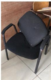
Silla tipo espera SSC-002101 SSC-INV-00309 SSC-INV-000115 5 Sin placa