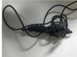
3 Cables HDMI color negro