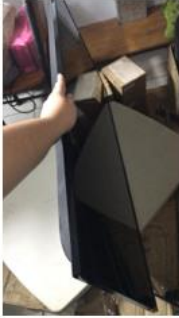
SSC-001835 Televisor de pantalla plana. SAMSUNG

A continuación, algunas fotografías de los activos para dar de baja: