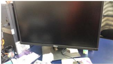
Monitor DELL SSC-000410