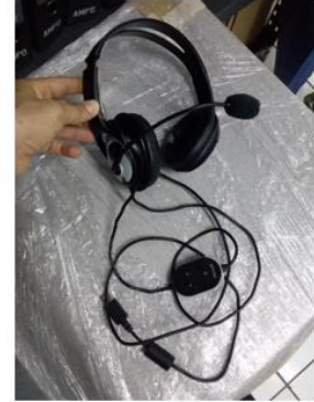
Headset SSC-001733 Headset SSC-001741

Se muestra la lista completa de los activos para dar de baja: