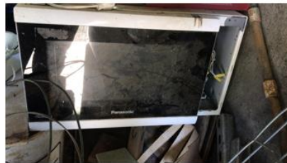
Horno microondas SSC-000584 Horno microondas SSC-000585