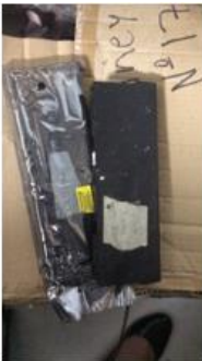
2 baterías portátiles