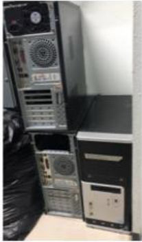
Case CUNA 7749 CUNA 7759 CUNA 7773