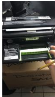
4 Unidades de imagen