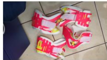
4 Collares cervicales