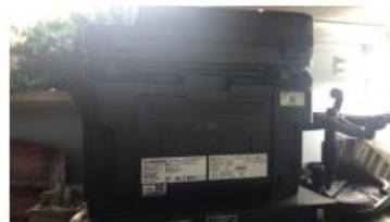
Impresora RICOH SSC-000207